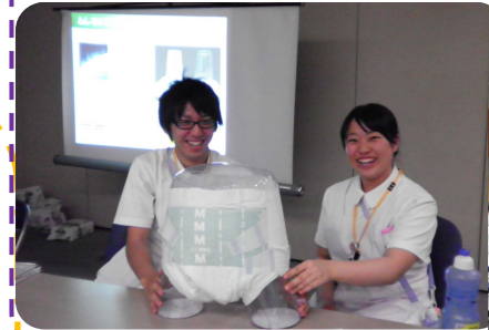
完璧なおむつ装着と講師に褒めてもらいました