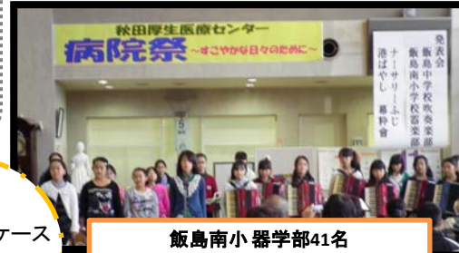
飯島南小器学部41名