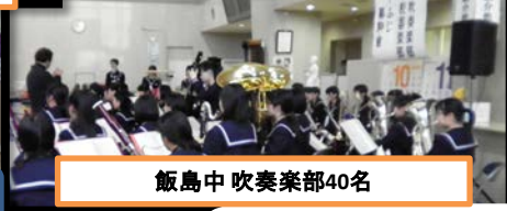
飯島中吹奏楽部40名