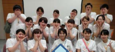
小顔ポーズって初めて知りました。