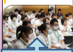
多数の参加者が真剣に聞きました。

H.26.10.1(水) 卒後2年目看護師のケースレポート発表会が行われました。今年度は16名が其々のケースを通して、看護師として何を大切にしていけるかを深く考える機会となったようです。皆さんとても立派でした。