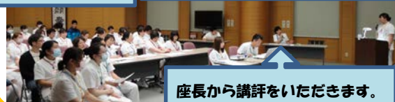
座長から講評をいただきます。