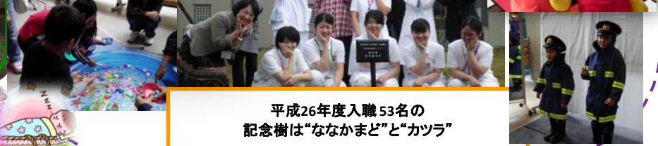
平成26年度入職53名の 記念樹は“ななかまど”と“カツラ”