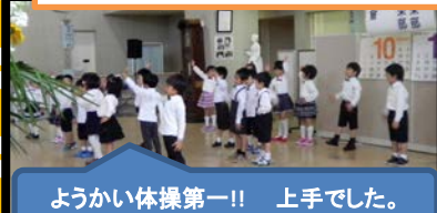
ようかい体操第一!! 上手でした。