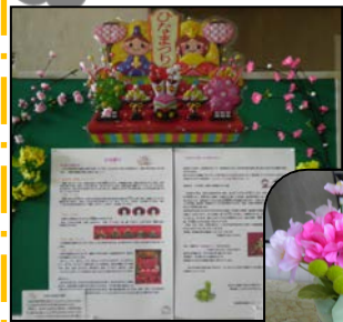
サービス向上委員会