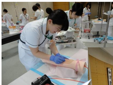
注射! 真剣なまなざし