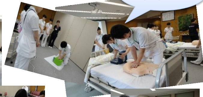
心臓マッサージ 1. 2. 3!!